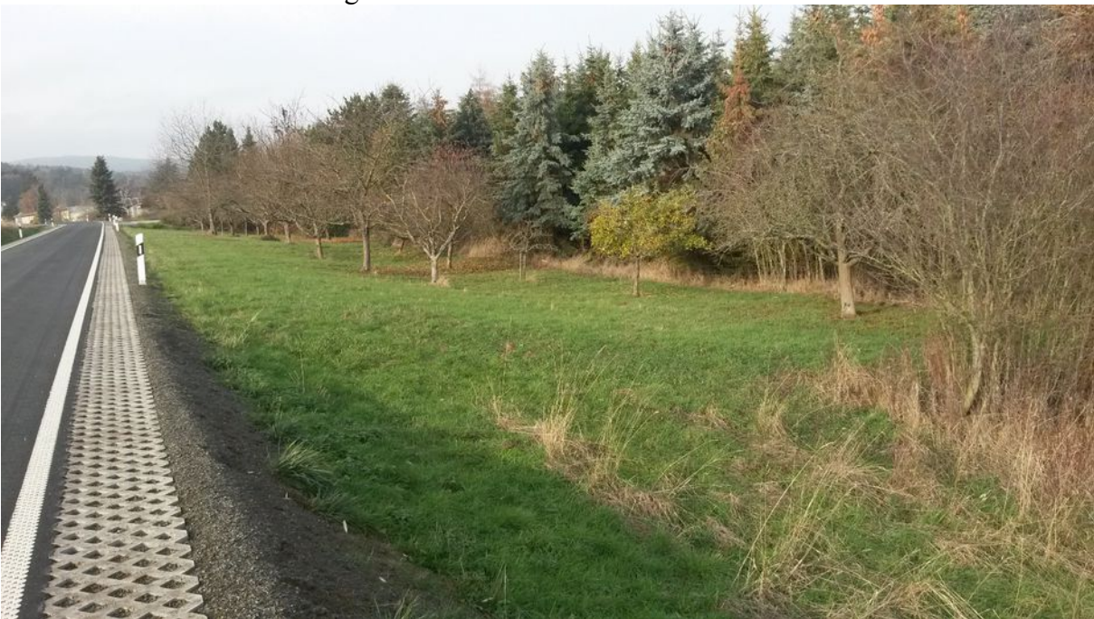
Ansicht von Fauerbach Richtung Münster, zurzeit genutzter „Weg“