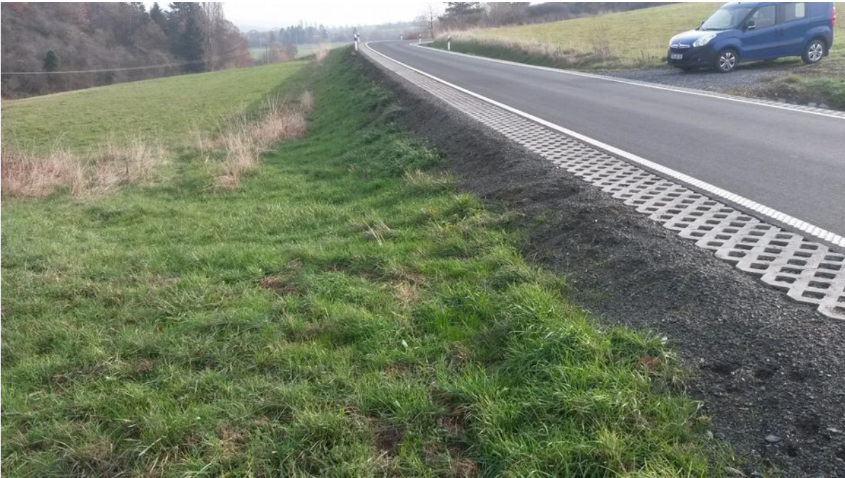
Ansicht von Münster Richtung Fauerbach

Weg (Fl.6FlSt.18) Auf den Brühläckern über L3353 nach Weg (Fl.6FlSt.55) Vor dem Wadenzahl GRENZWEG ZUR GEMARKUNG FAUERBACH BRÜHL UND MÜLLERKOPF